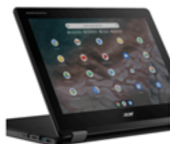
Acer Chromebook R853TA 341,64€ - 515,64€

IMPORTANT El model de la imatge és només un exemple. El procés de compra és sempre el mateix. Quan poseu el codi del col·legi, us apareixerà el portàtil que el centre ha recomanat per als alumnes del mateix.