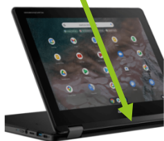
Acer Chromebook R853TA 329,00€ - 447,00€ PVP. IVA incluido

IMPORTANTE: El modelo de la imagen es un ejemplo. El proceso de compra es siempre el mismo. Cuando pongáis el código del colegio, os aparecerá el portátil que el centro ha recomendado para los alumnos del mismo.